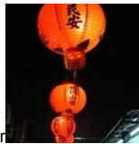
Esperança num futuro iluminado