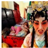
Vestida (e mascarada) a rigor