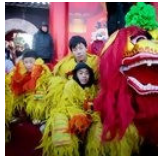
As partes de um dragão