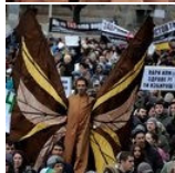
Dar asas ao manifesto