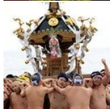
Um altar à beira-mar