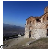
Santíssima Trindade, na Albânia